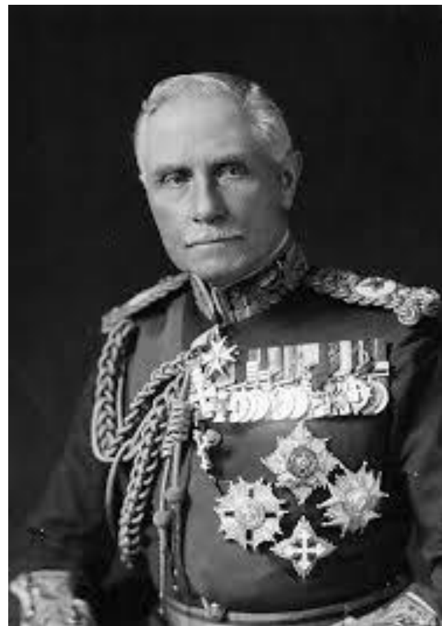
Field Marshal Lord Milne