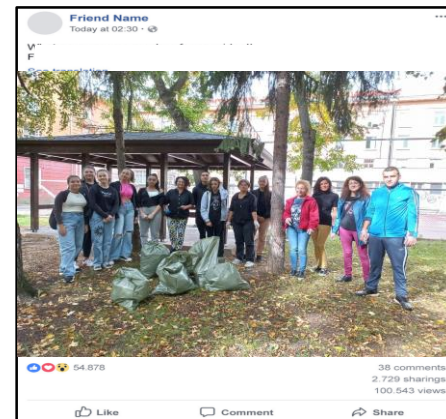
Участие в масови кампании за опазване на околната среда